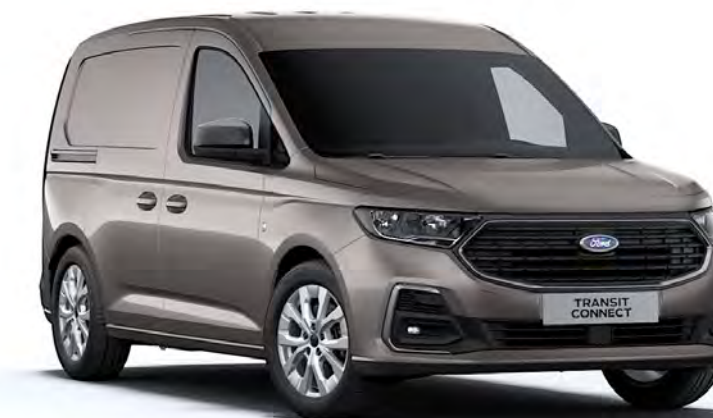
Dusky Silver Colore carrozzeria metallizzato*