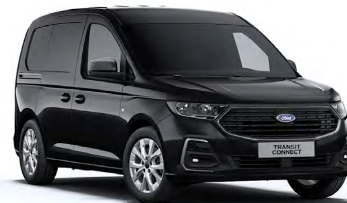
Ink Black Colore carrozzeria metallizzato*