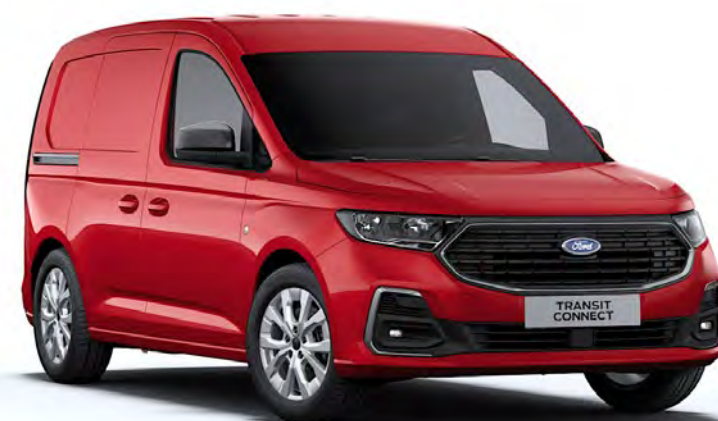
Lava Red Colore carrozzeria solido