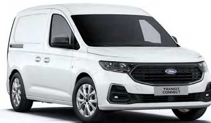
Frozen White Colore carrozzeria solido