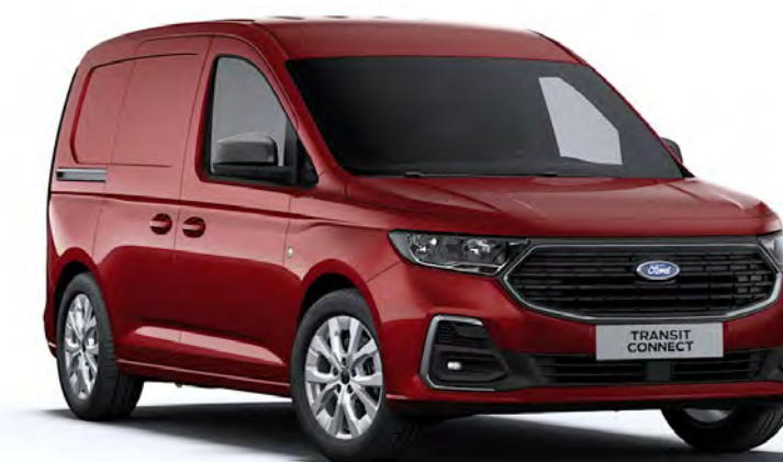
Maple Red Colore carrozzeria metallizzato*