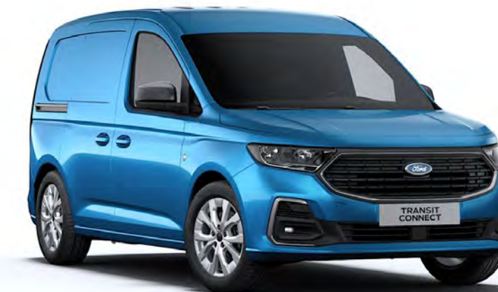
Boundless Blue Colore carrozzeria metallizzato*

Nota: Le immagini dei veicoli utilizzate illustrano solo i colori carrozzeria e potrebbero non corrispondere alle caratteristiche correnti o alla disponibilità prodotto in alcuni mercati. I colori e le rifiniture riprodotti in questa pubblicazione possono variare dai colori reali a causa dei limiti e della varietà di opzioni visualizzazione utilizzate.