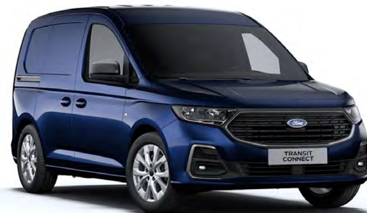
Midnight Blue Colore carrozzeria metallizzato*