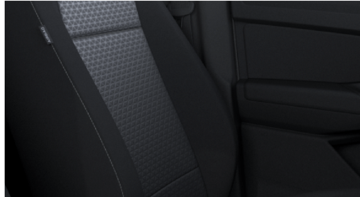
Bubble Ford Kylo Emboss in Soul/Clip in Soul/Clip in Soul (con cuciture grigie) Di serie su Titanium