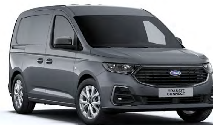
Comet Grey Colore carrozzeria solido