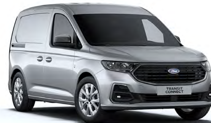
Stardust Silver Colore carrozzeria metallizzato*