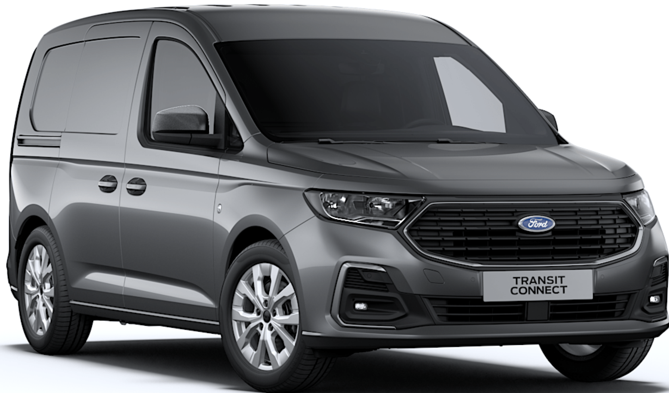
Graphite Grey Colore carrozzeria metallizzato*

Ford Transit Connect deve la grande resistenza degli esterni ad un processo di verniciatura multi-livello, che permette al nuovo veicolo di mantenere la sua estetica per molti anni.