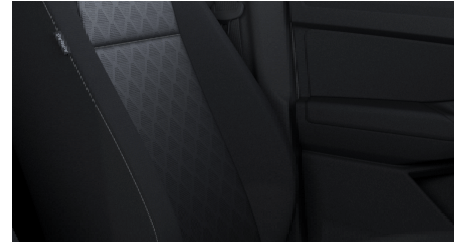
Ford Diamond perforato Sensico® in Soul/Bison MINI GRAIN Sensico® in Soul Opzionale su Titanium