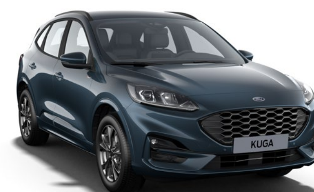
Chrome Blue Colore carrozzeria metallizzato*