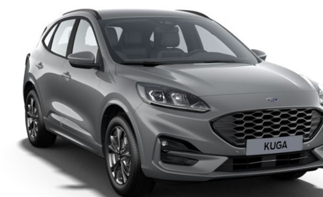
Solar Silver Colore carrozzeria metallizzato*