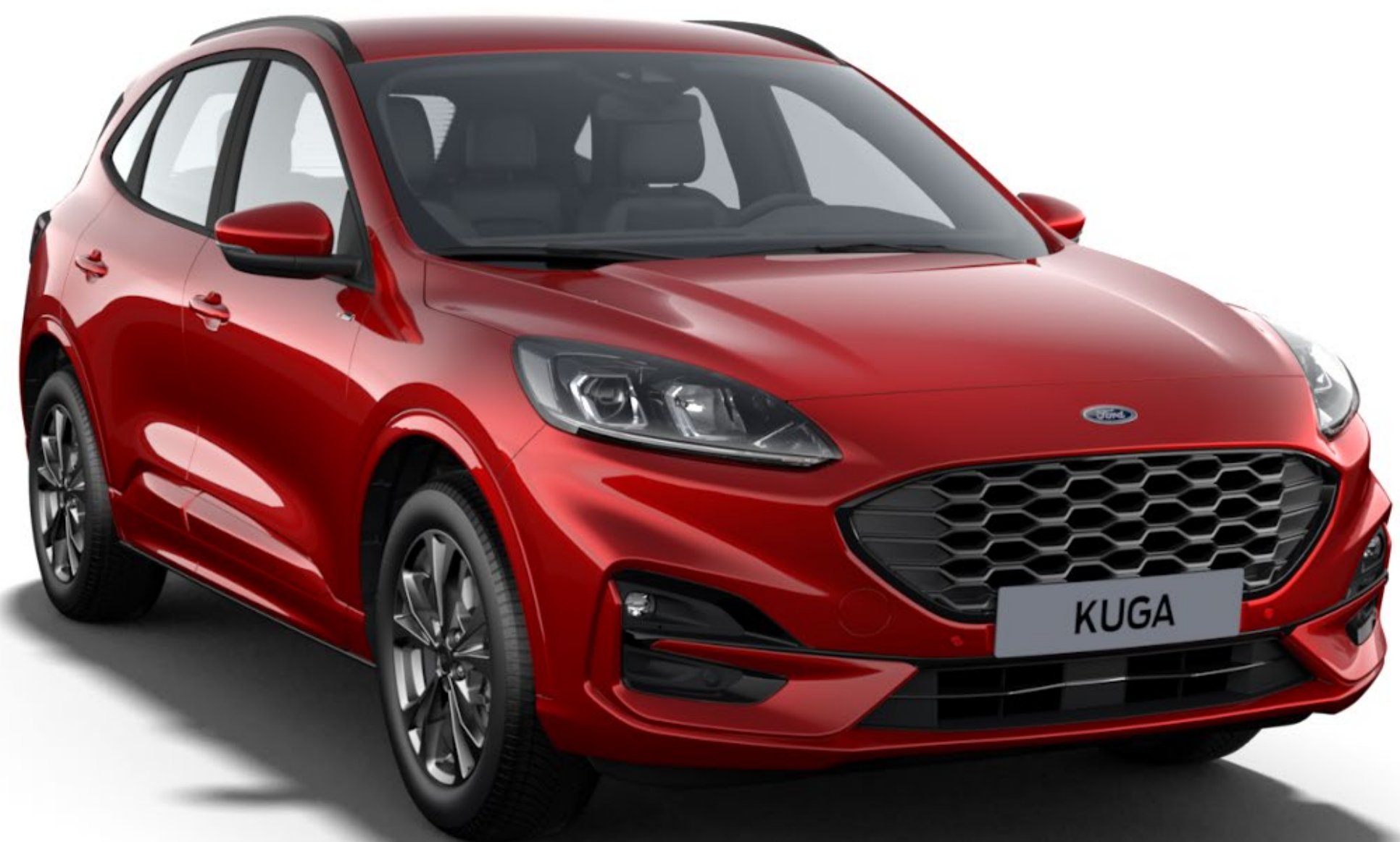
Lucid Red Colore carrozzeria Premium*

La nuova Ford Kuga deve la bellezza e la resistenza dei suoi esterni ad un processo speciale di verniciatura multifase. Dalle sezioni della carrozzeria trattate con iniezioni a cera al rivestimento superiore protettivo, i nuovi materiali e i processi di applicazione garantiscono la qualità estetica della tua Kuga per molti anni a venire.