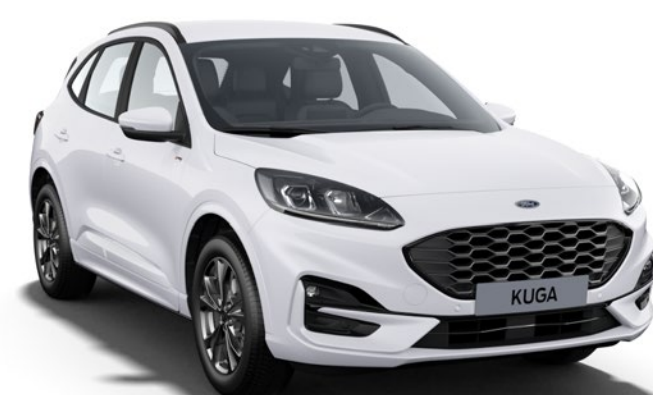
Frozen White Colore carrozzeria pastello*