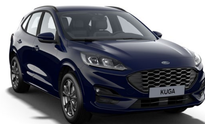
Blazer Blue Colore carrozzeria solido