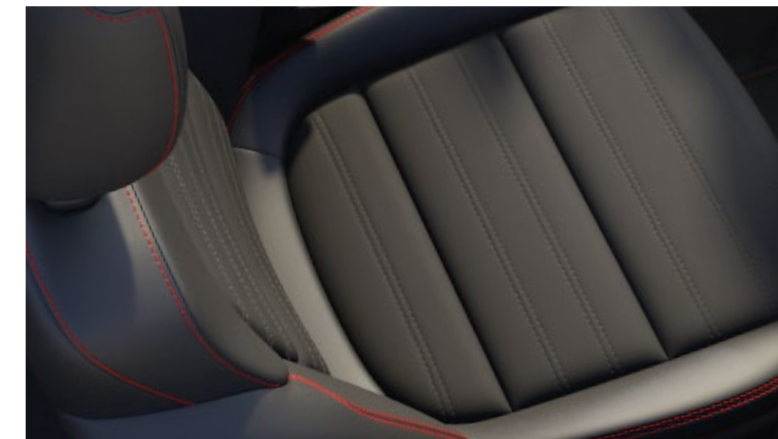
Interni Sensico® Premium Touch Di serie su ST-Line X*

*Disponibile con la regolazione elettrica del sedile guida a 10 vie su serie X.