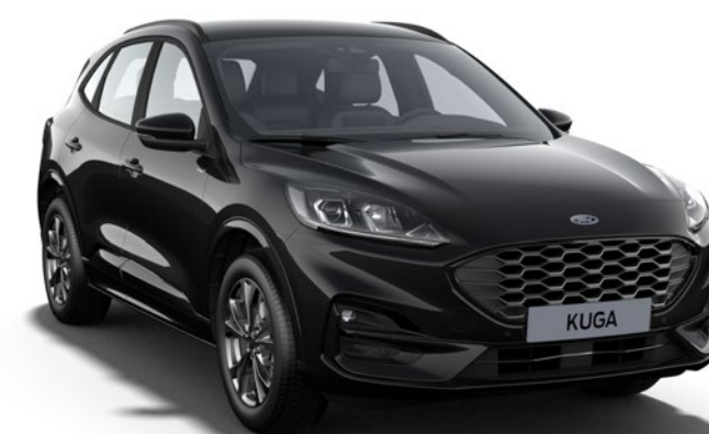
Agate Black Colore carrozzeria metallizzato*