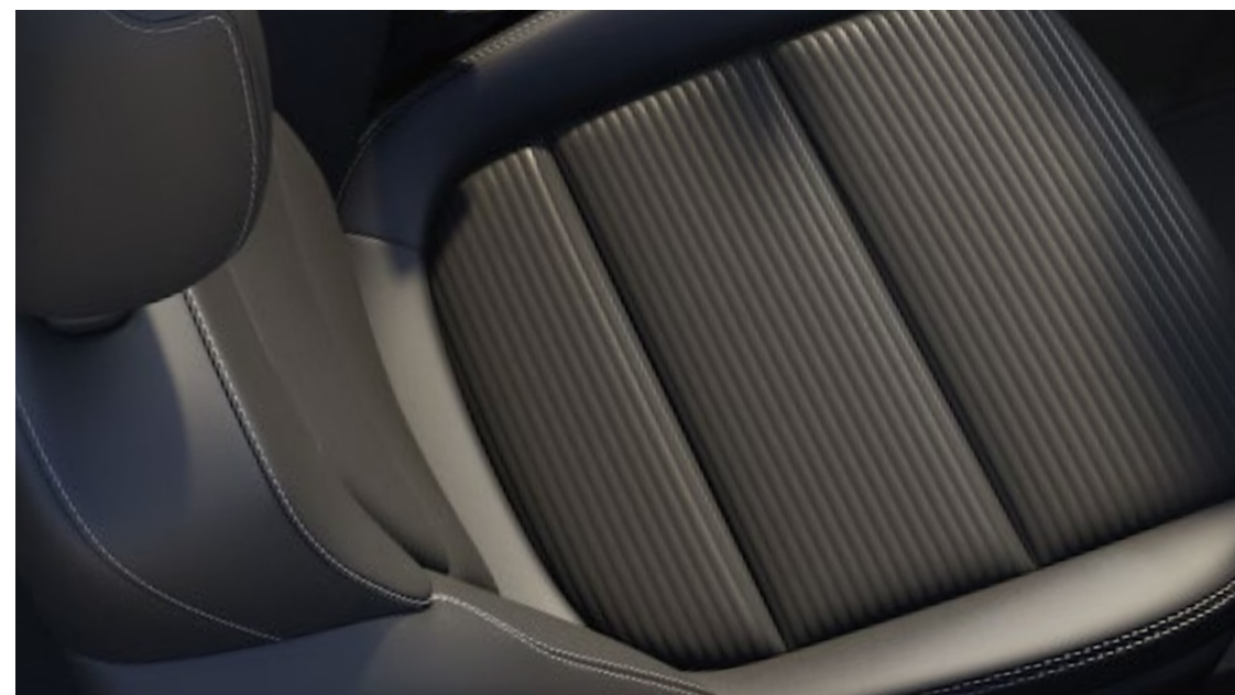
Interni Sensico® Premium Touch Ray in Black Di serie su Titanium X*