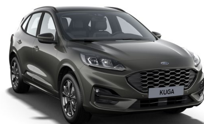
Magnetic Grey Colore carrozzeria metallizzato*