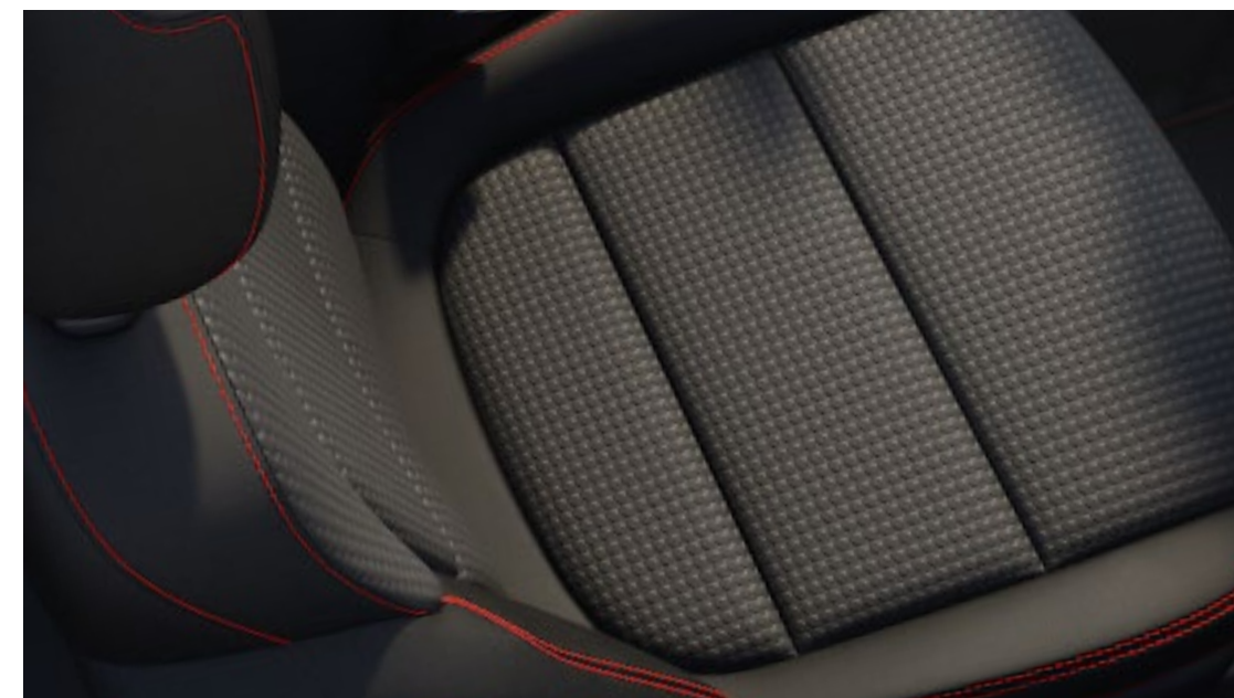
Interni in tessuto nero: Foundry/Eton Di serie su ST-Line